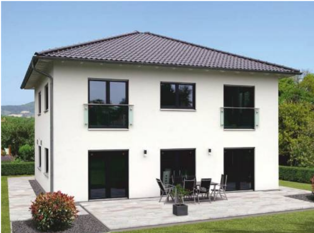
Abbildung zeigt Variante