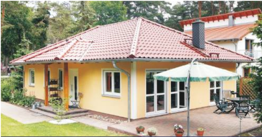
Abbildung zeigt Variante